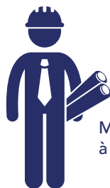
Missions d'assistance à maîtrise d'ouvrage